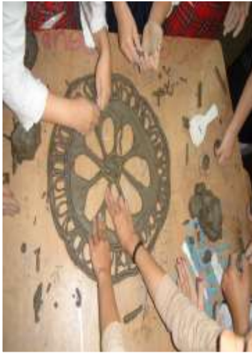
Rozasa e gata