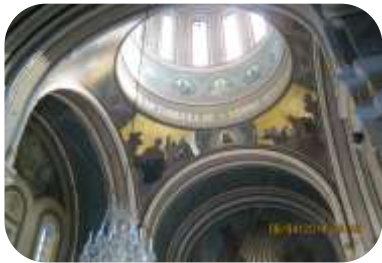
Cupola elegantei ctitorii a arhitectului Dimitrie Maimarolu, Biserica Armenească din București